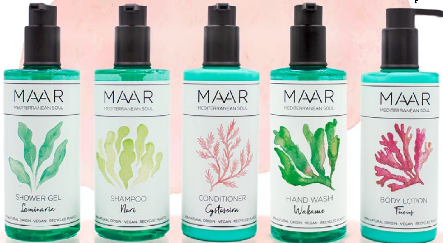
Línea de dispensadores MAAR de 300ml para hotel