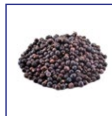
Bayas de enebro