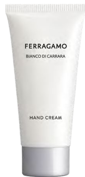
CREMA DE MANOS