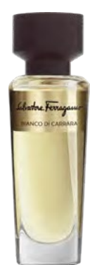
FRASCO DE PERFUME