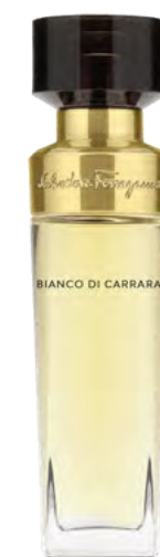
FRAGANCIA DE VIAJE