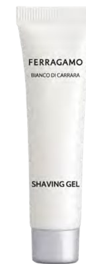
GEL DE AFEITADO